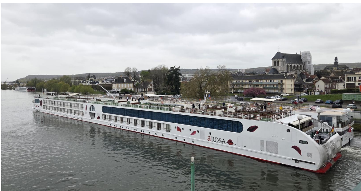
Die A-ROSA VIVA vor Anker in Vernon.