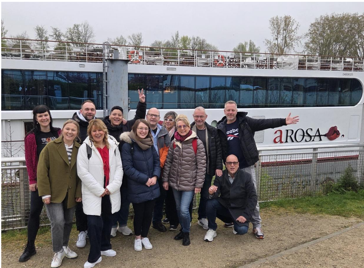
Gut gelaunte Teilnehmerinnen und Teilnehmer der Inforeise von rtk und Reiseland mit der A-ROSA VIVA auf der Seine.