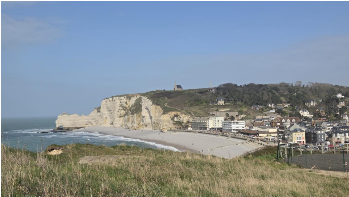
Die Klippen von Etretat